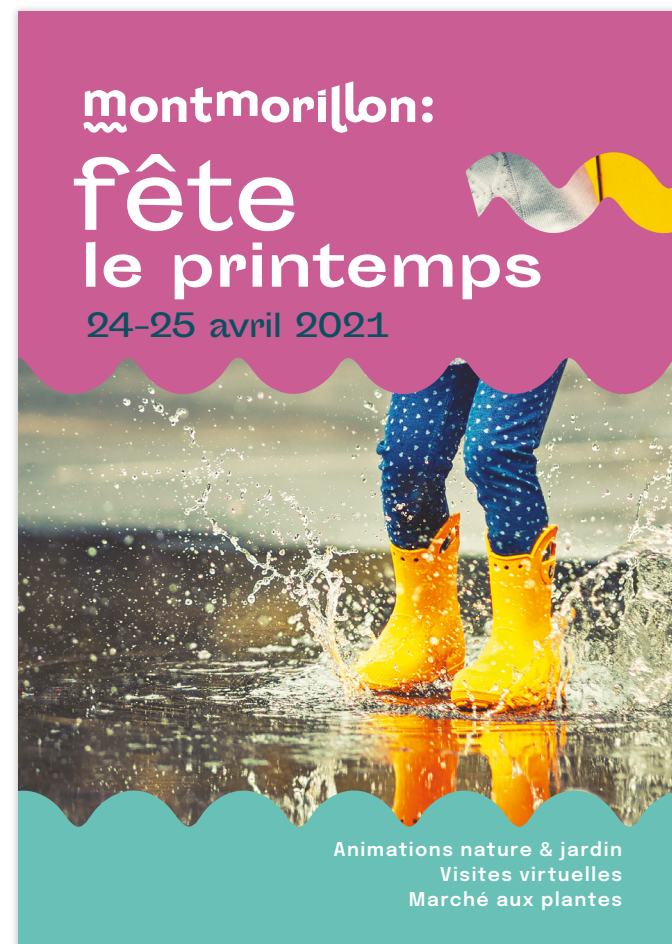
avec les vagues sur fond photographique