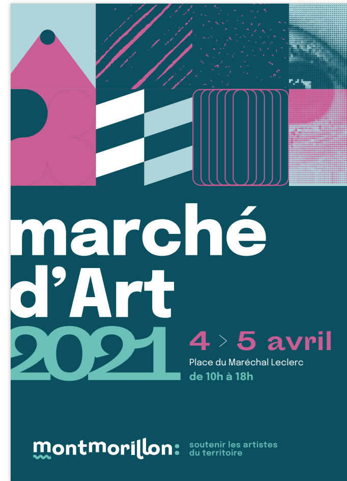
avec photographie et/ou illustration