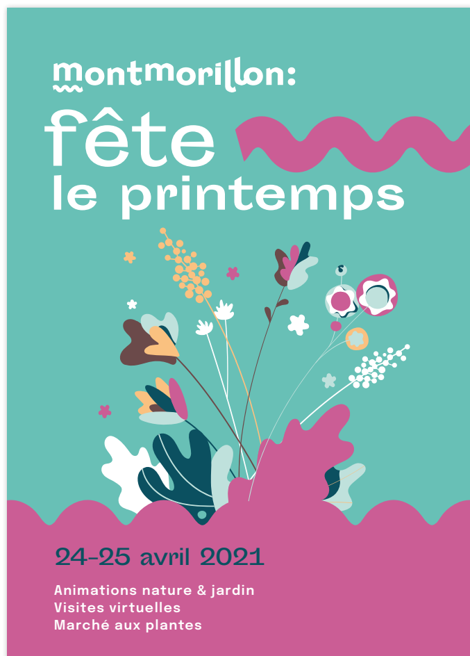
avec les vagues sur fond illustré