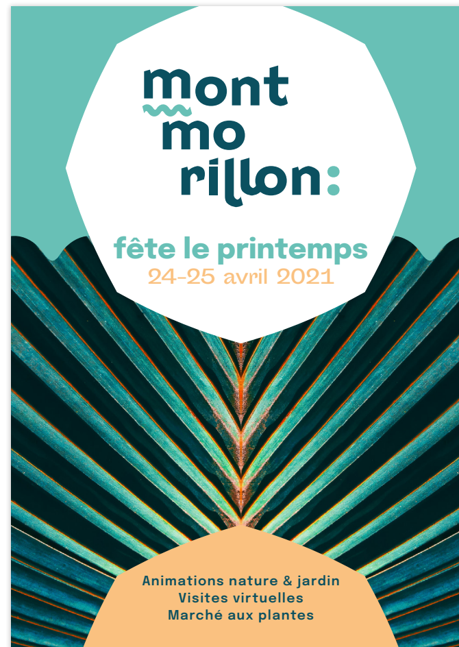
avec cartouche octogonale sur fond photographique