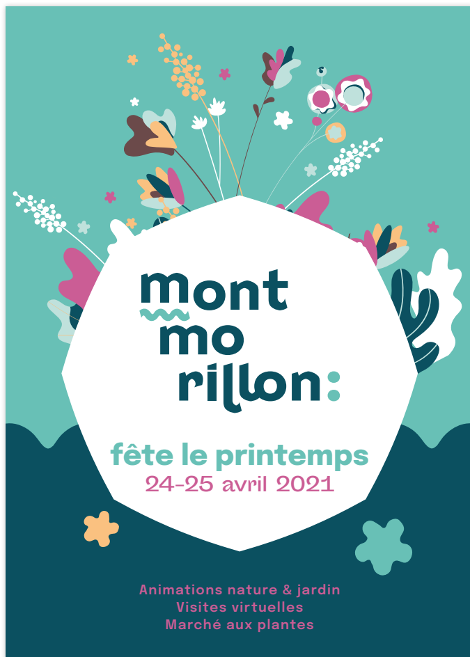
avec cartouche octogonale sur fond illustré