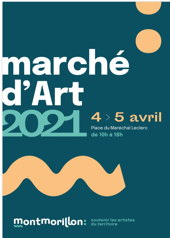
intervention graphique uniquement