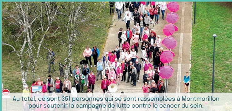
Au total, ce sont 351 personnes qui se sont rassemblées à Montmorillon pour soutenir la campagne de lutte contre le cancer du sein.

En octobre dernier, la ville de Montmorillon se mobilisait pour la campagne de dépistage du cancer du sein. Au total, ce sont 230 marcheurs, 20 coureurs, 60 motards et 41 nageurs qui se sont mobilisés et ont permis de faire vivre les actions proposées par la municipalité en faveur de cette édition 2023 de la campagne « Octobre Rose » !