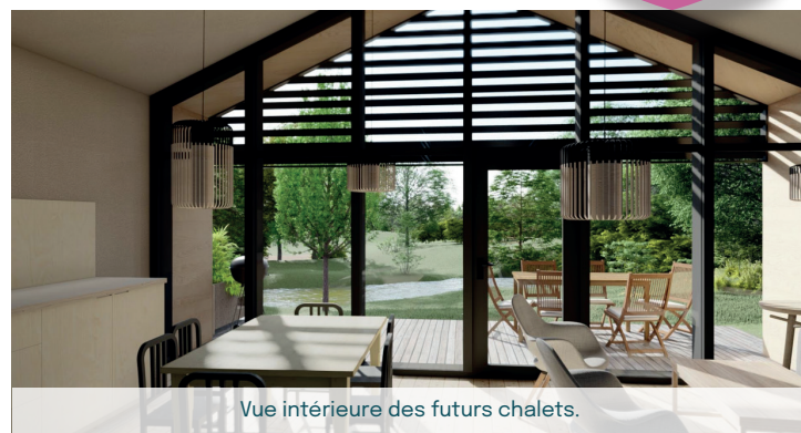
Vue intérieure des futurs chalets.

Le camping municipal de l'Allochon offre des espaces de qualité aux campeurs et touristes de passage sur notre commune. Sur plus de 2 hectares ombragés, au cœur desquels coule le ruisseau l'Allochon, les touristes peuvent profiter du calme offert par ce site remarquable, à deux pas du centre-ville. Au cours de l'année 2023, près de 2 230 campeurs ont séjourné au camping, pour 4 200 nuitées.