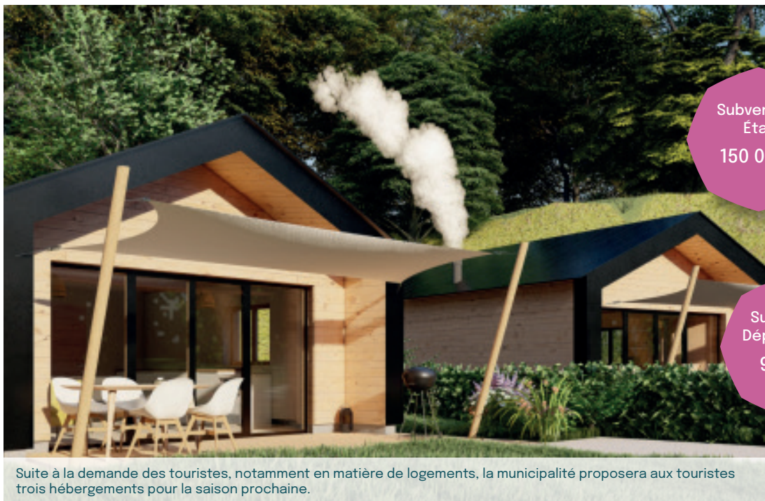
Suite à la demande des touristes, notamment en matière de logements, la municipalité proposera aux touristes trois hébergements pour la saison prochaine.