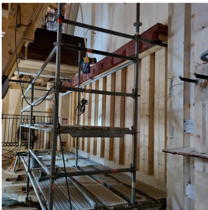
Le moilage du mur nord et l'étaieement intérieur de l'édifice seront retirés une fois les cavités comblées et le mur consolidé par des micro-pieux.

À ce jour, nous n'avons pas encore le retour de tous les financeurs sollicités.