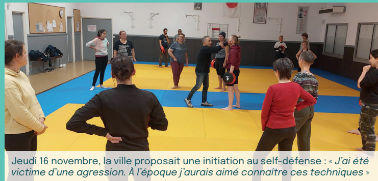
Jeudi 16 novembre, la ville proposait une initiation au self-défense : « J'ai été victime d'une agression. A l'époque j'aurais aimé connaître ces techniques »

Très engagée dans la lutte contre les violences faites aux femmes, Montmorillon a proposé, tout au long du mois de novembre, de nombreuses actions et rencontres afin de sensibiliser les actrices et acteurs de la société civile ainsi que les citoyens à cette problématique. Une campagne qui a su rencontrer un franc succès au regard de la participation.